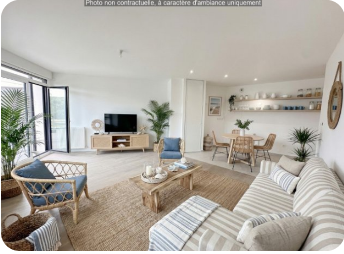
Photo non contractuelle, a caractère d'ambiance uniquement