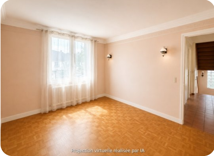
Projection virtuelle réalisée par IA